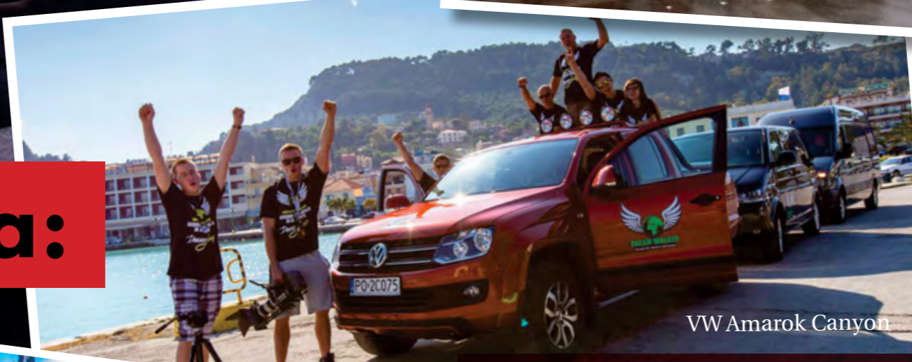
VW Amarok Canyon