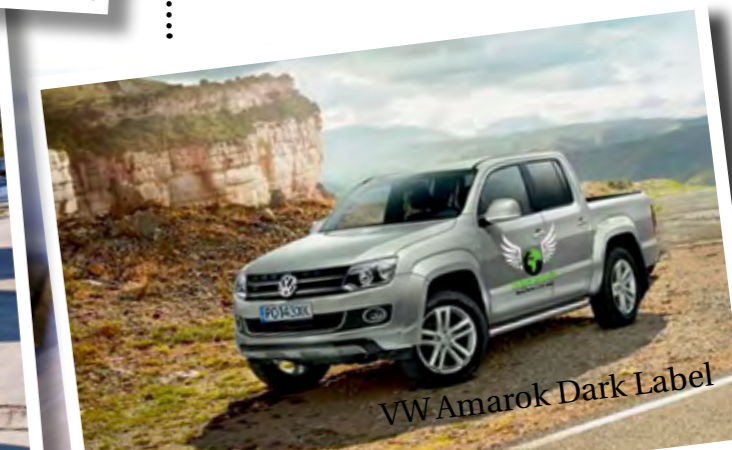
VW Amarok Dark Label