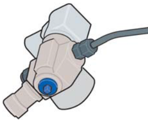
Ręczny zawór odcinający na zaworze głównym zbiornika